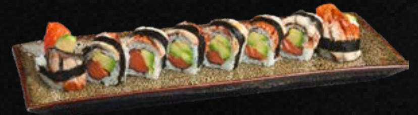
S52. UNAGI QUEEN C,G,L 16,50 Bio Lachs, Avocado, Frischkäse ummantelt mit gegrilltem Aal & Spezialsoße