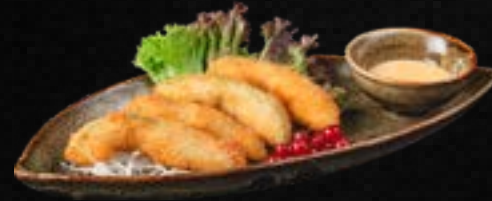
V13. CRUNCHY AVOCADO (4 STK.) D,G,L 5,90 Frittierte Avocado, dazu Spicy Mayo – Dip