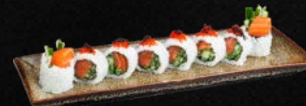
S32. KAPPA SAKE I.O c,g 10,50 Bio Lachs, Gurke, Frischkäse, garniert mit Tobiko