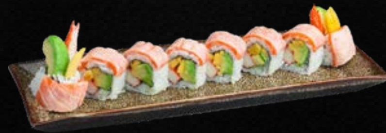
S50. SAKE FIRE *,C,G,L 15,50 Krebsfleisch, Avocado, Mango, Frischkäse, ummantelt mit flambiertem Bio Lachs & Spezialsoße