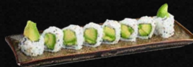
S28. AVO I.O L,g 9,50 Avocado ummantelt mit Sesam