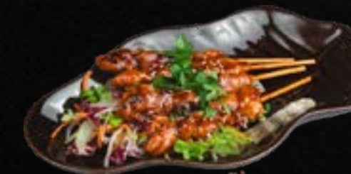
V16. YAKITORI (4 STK.) L 6,50 Jap. marinierte Hühnerspieße mit Lauch & Sesam