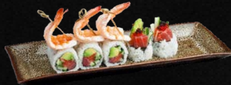
S48. EBI FUTO C,E,G,L 16,50 Bio Lachs, Thunfisch, Avocado, Gurke, Frischkäse ganiert mit gekochtem Garnelen