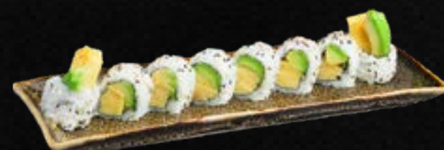
S40. TAMAGO I.O. A,G,L 9,50 Eierstich, Avocado ummantelt mit Sesam