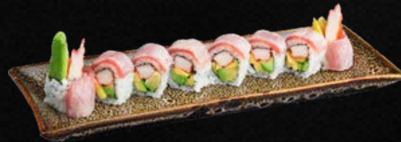
S49. FANCY TUNA *,C,G,L 15,90 Krebsfleisch, Avocado, Mango, Gurke, Frischkäse ummantelt mit flambier- tem Thunfisch & Spezialsoße