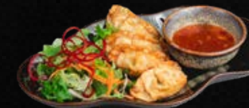
V15. GYOZA (4 STK.) D,G,A Knuspr. gefüllte Teigtaschen, dazu Sweet Chili – Dip. Wahlweise mit: A) Gemüse L 5,90 B) Huhn 6,50