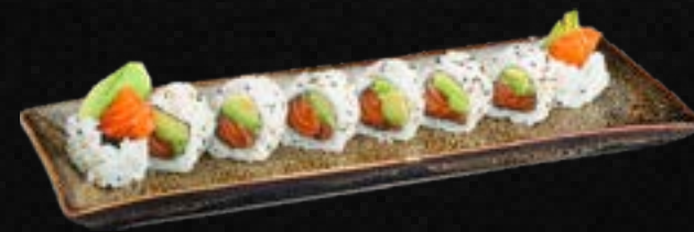
S39. AVO PHILA I.O. G,L 10,50 Bio Lachs, Avocado, Frischkäse, ummantelt mit Sesam