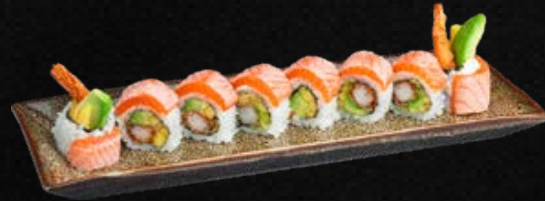
S47. CRISPY TIGER C,D,E,G,L 15,50 Garnelen Tempura, Avocado, Mango, Frischkäse ummantelt mit flambiertem Bio Lachs & Spezialsoße