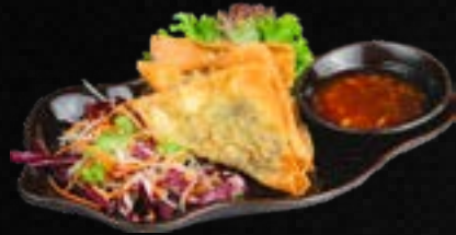
V7. WANTAN CHIÊN (3 STK.) D 3,90 Knuspr. Teigtaschen mit Schweinefleischfüllung, dazu Süß-Sauer-Dip