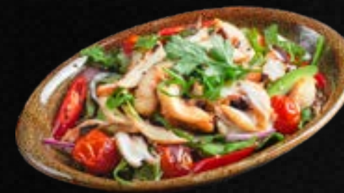
V12. TAKO SALAD G,L,N 10,50 Gegrillter Oktopus, Avocado, Kirschtomaten, Koriander, Zwiebeln & hausgemachter Dressing