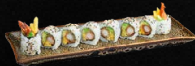
S36. EBI EXTREME I.O. D,E,G,L 12,50 Garnelen Tempura, Avocado, Mango, Frischkäse, ummantelt mit Sesam & Spezialsauce