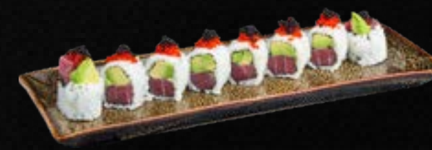
S33. AVO TUNA I.O c,g 11,50 Thunfisch, Avocado, Frischkäse, garniert mit Tobiko