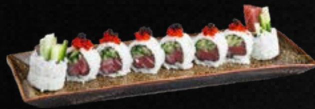
S34. KAPPA TUNA I.O. C,G 11,50 Thunfisch, Gurke, Frischkäse, garniert mit Tobiko