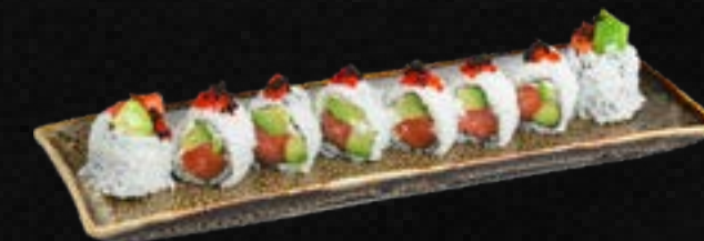
S31. AVO SAKE I.O c,g 10,50 Bio Lachs, Avocado, Frischkäse, garniert mit Tobiko