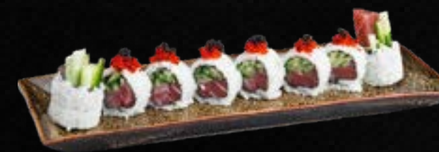
S30. SPICY TUNA I.O c,g 11,50 Thunfisch in Spicy Mayo, Gurke, Lauch, Frischkäse, garniert mit Tobiko (scharf)