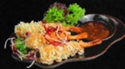
V8. TÔM CHIÊN CỐM (3 STK.) D,E 6,90 Knuspr. Garnelen ummantelt in Reisflocken, dazu Sweet Chili – Dip