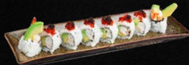
S35. AVO EBI I.O. C,G 11,50 Gekochte Garnelen, Avocado, Frischkäse, garniert mit Tobiko