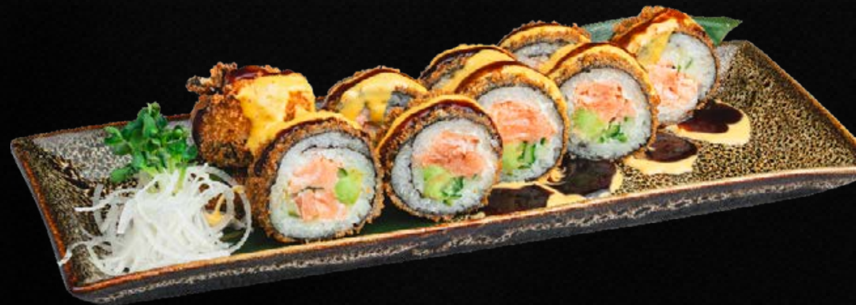
S42. CRUNCHY SAKE C,D,G,L 8,90 / 15,90 5 Stk. / 10 Stk. Bio Lachs, Avocado, Gurke, Lauchzwiebeln, Frischkäse in Tempurateig mit Spezialsoße