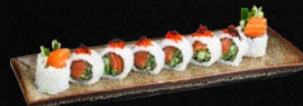
S29. SPICY SAKE I.O c,g 10,50 Bio Lachs in Spicy Mayo, Gurke, Lauch, Frischkäse, garniert mit Tobiko (scharf)