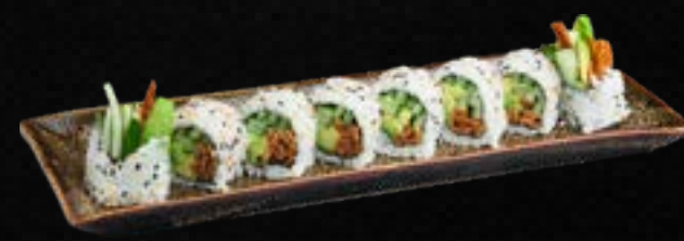
S41. VEGGI I.O. L,M 9,50 Tofutasche, Avocado, Gurke, ummantelt mit Sesam