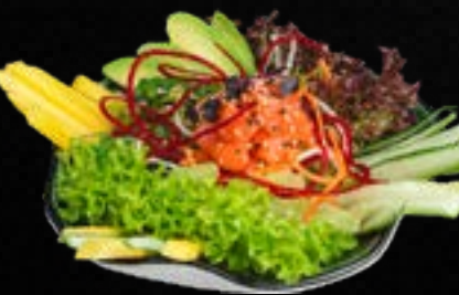
V11. Á BOWL C,L,M Salat mit Avocado, Edamame, Goma Wakame, Gurke, Mango & Sesamsoße. Wahlweise mit: A) Rohem Lachs 9,50 B) Rohem Thunfisch 10,50