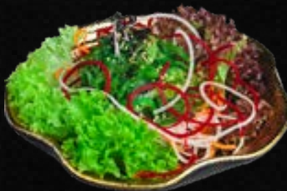
V9. GOMA WAKAME L,M 5,90 Jap. marinierter Seealgensalat mit Sesam