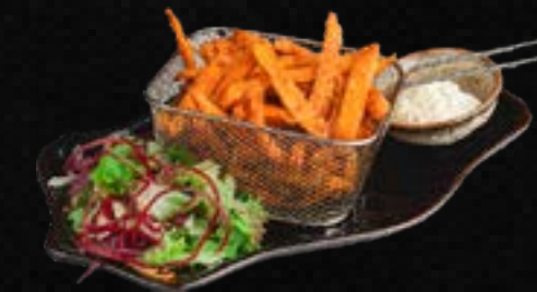
V14. KHOAI LANG CHIÊN D,G,A 5,90 Süßkartoffelpommes, dazu Spicy Mayo – Dip