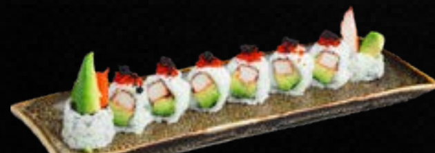
S37. CALIFORNIA I.O. C,G,* 10,90 Krebsfleisch, Avocado, Frischkäse, garniert mit Tobiko