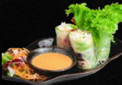
V10. GỎI CUỐN (2 STK.) Sommerrollen mit Reismudeln, Salat, Mango, Gurke, frischen Kräutern, dazu Erdnuss-Dip. Wahlweise mit: A) Tofu B,M 5,90 B) Huhn B,D 6,90 C) Garnelen B,D 7,90