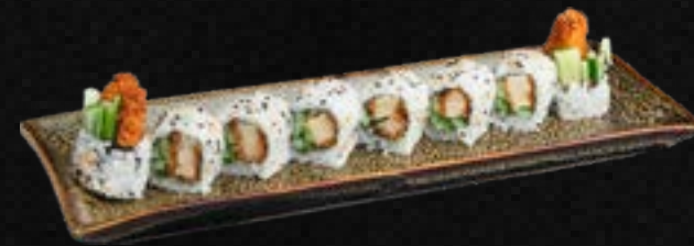
S38. TORI I.O. D,G,L 10,50 Knuspr. Hühnchen, Gurke, Frischkäse, ummantelt mit Sesam & Spezialsoße