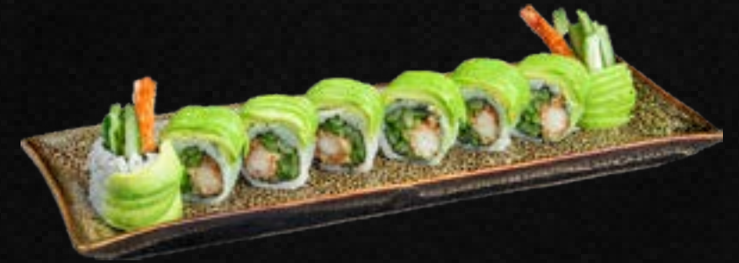
S51. DRAGON ROLL D,E,G,L 15,90 Garnelen Tempura, Gurke, Frischkäse, ummantelt mit Avocado & Spezialsoße