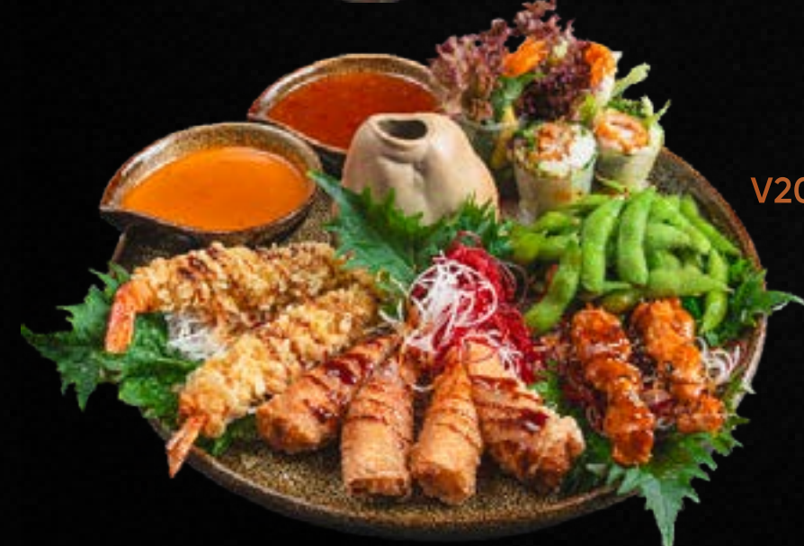
V20. STARTER MIX FÜR 2 A,B,D,E,G,L,M 20,90 Edamame, Frühlingsrollen mit Fleisch, Sommerrollen mit Huhn, knuspr. Garnelen, Hühnerspieße